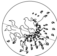
Bovist, Motiv "Dove", 540 x 540 x 380 mm