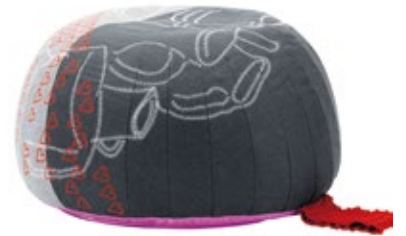
Bovist, Motiv "Pottery"

einen besonderen Reiz und an einem Griff aus gestricktem Garn kann Bovist ganz einfach in der Wohnung neu platziert werden.