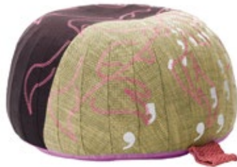
Bovist, Motiv "Dove"

Bovist ist dekoratives Bodensitzkissen, Hocker und Ottoman zugleich. Für die sympathische Form und den guten Sitzkomfort sorgen die seitlich vielfach abgenähten Hüllen und die Füllung aus kleinen Kunststoffkugeln. Grossflächige Stickereien verleihen dem aus verschiedenfarbigen Stoffen genähten Bezug