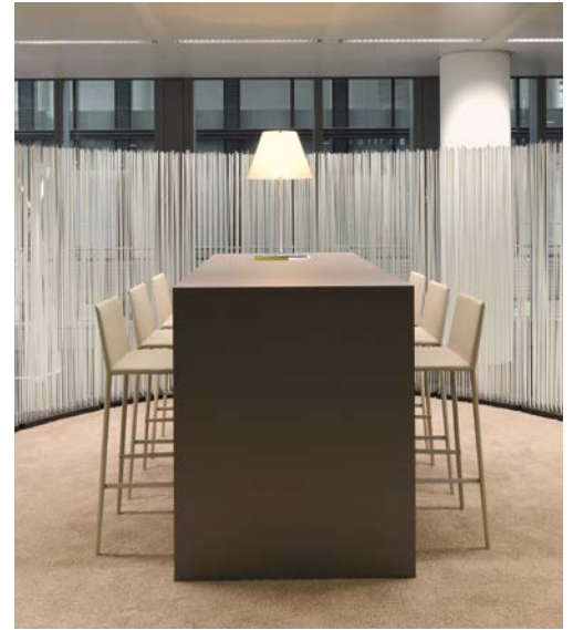
3 Lounge area Art. 1717