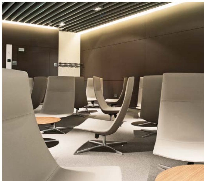
1 Hamilton Grange Teen Center New York Public Library NYC, USA Art. 2011