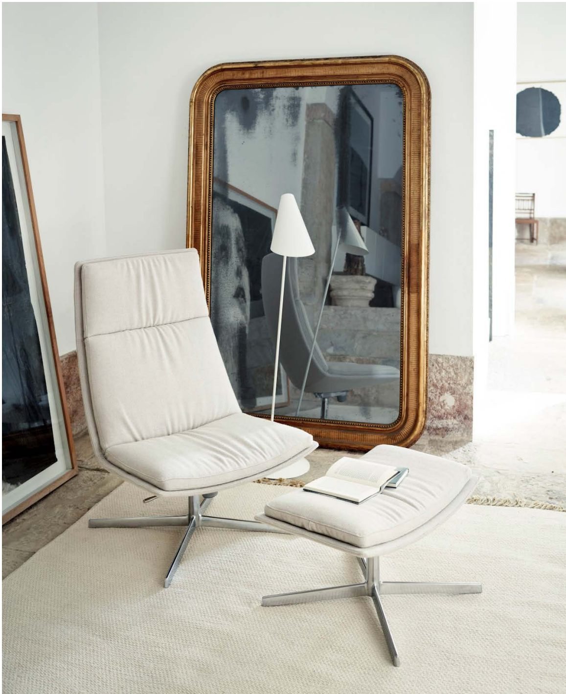
1 Private residence Lisbon, Portugal Art. 3300 Chair Art. 3302 Footrest