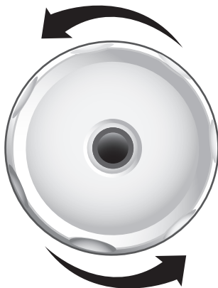
MASSAGE DOUX (sens antihoraire)