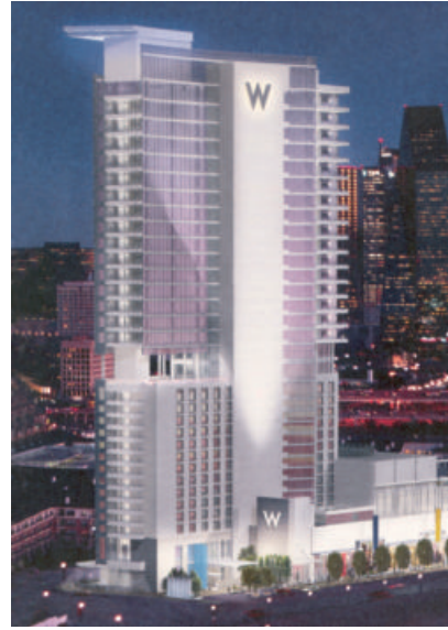
SatenGlas® Victory W Dallas (USA)