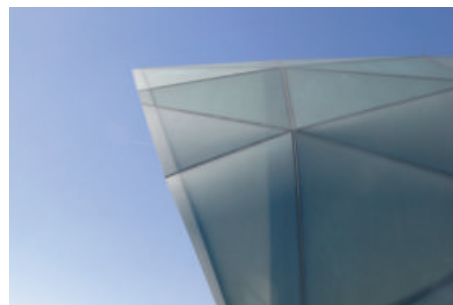
SatenGlas® 8 y 10 mm Hangar 7-B. Salzburg Airport (Austria)

"ift Rosenheim" measurement following norm DIN 67507 and European Standard EN 673.