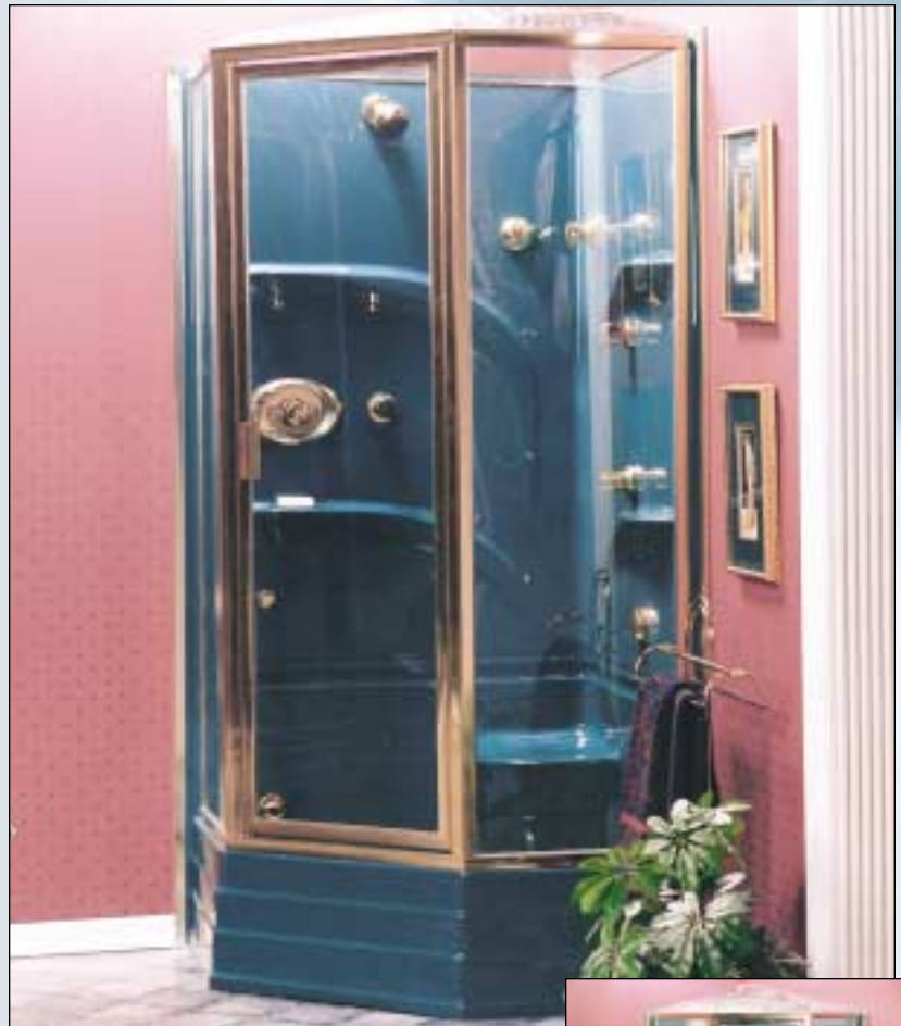
Door not exactly as shown