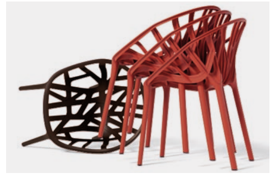
Les chaises Vegetal s'empilent par trois.